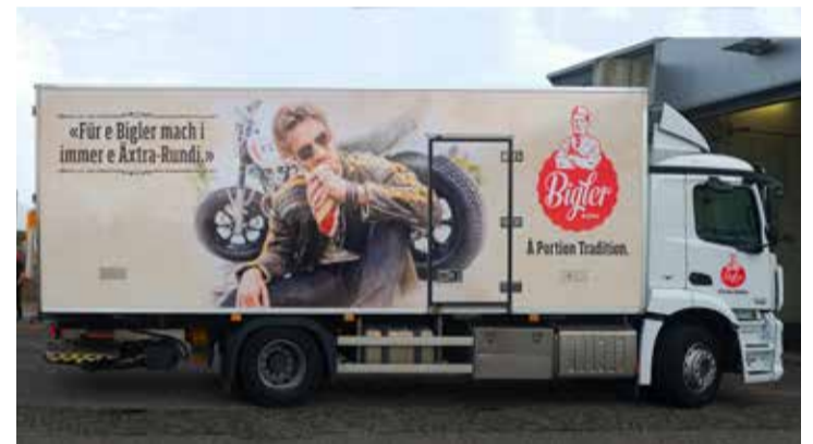
Les visuels publicitaires au look rétro ornent 60 véhicules de l'entreprise Bigler AG. Remund Werbetechnik AG a rempli sa mission en six semaines.

« Nous souhaitons ainsi souligner le fait qu'avec son nom, la famille Bigler offre une garantie de qualité maximale. »