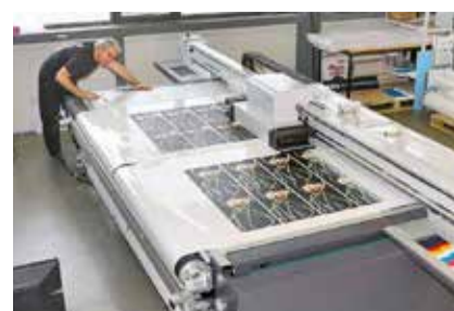
Impressions possibles sur divers matériaux souples et rigides comme le plexiglas.

Largeur de la table : 3,2 mètres; impression à plat et/ou en rouleau; table optimisée pour différents matériaux souples et rigides comme les panneaux composites d'aluminium, le PVC, le bois, les bâches, le verre...; impression de blanc, impression laquée mate, brillante et avec effet laqué partiel ou total.