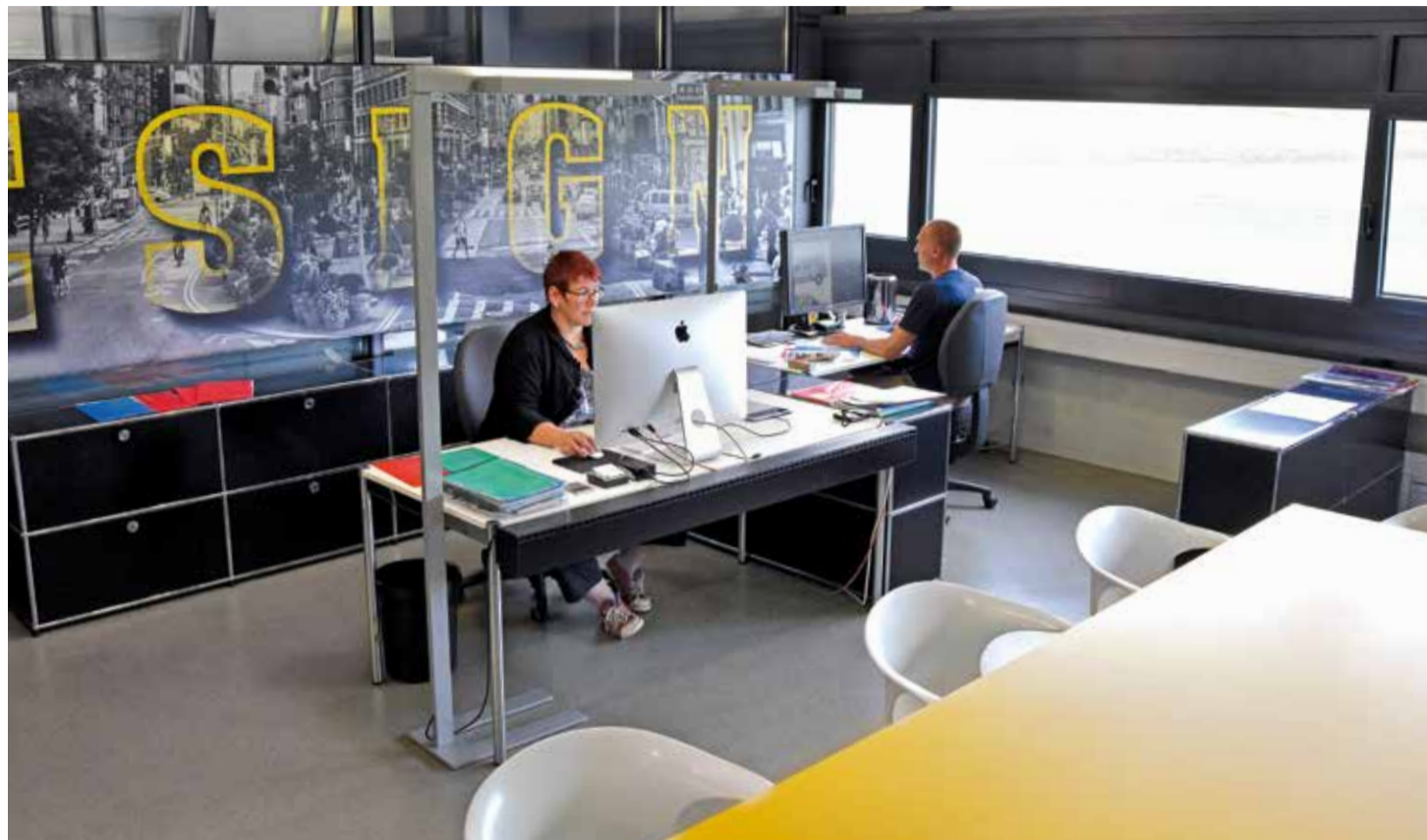
Graphistes concentrés sur leur travail dans notre studio de design doté d'équipements techniques ultra modernes.

Nous serons ravis de vous aider à définir vos besoins et vos attentes afin de vous livrer un résultat à la hauteur de vos souhaits. Appelez-nous au 031 754 54 44