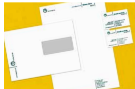
Après discussion avec le client, les premières créations sont esquissées. Les propositions seront présentées lors de la réunion suivante pour discuter des modifications. Ici, le papier en-tête, les cartes de visite, le descriptif de voiture, etc. réalisés véhiculent une image unifiée de l'entreprise.